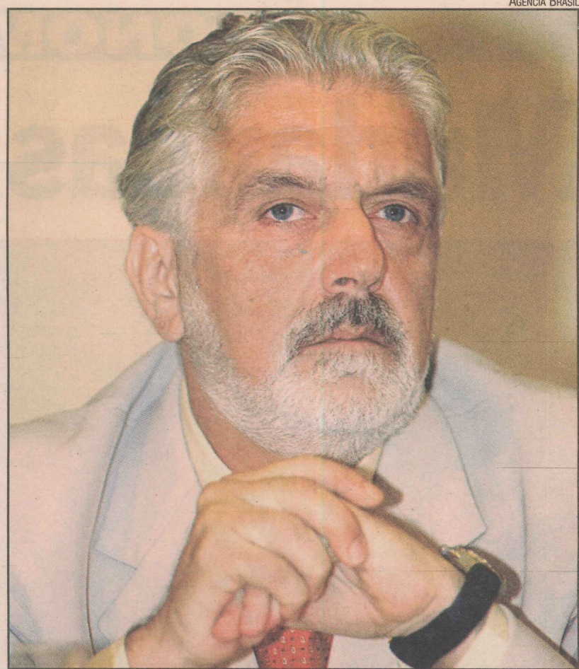
Jaques Wagner disse que a nova metodologia não prejudica

"Eles passaram a investigar, ocupação e desocupação, emprego e desemprego, a partir da idade de 10 anos. Antes era feita a partir dos 15 anos, e em função disso houve essa modificação. Ocorreu ainda uma pequena queda na taxa de desemprego no mês de dezembro de 2002", acrescentou o ministro da Previdência.