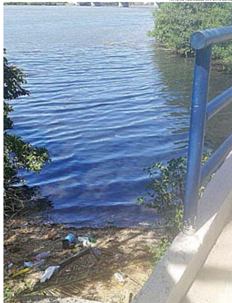
A FOZ do Rio Marinho fica em Cariacica e deságua na Baía de Vitória