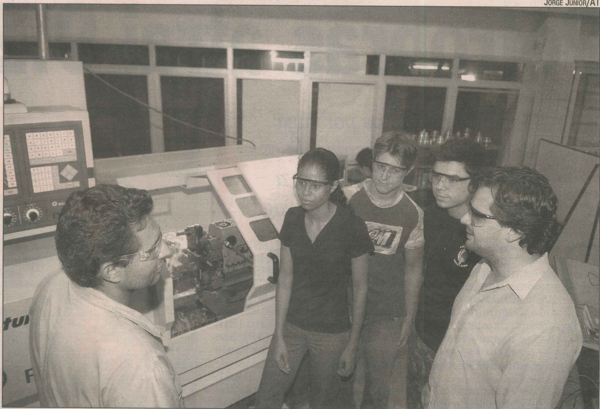
Alunos do curso de mecânica do Senai, que apontou as áreas onde há carência de pessoal

Segundo ela, o crédito em forte expansão e a massa salarial crescente propiciam o bom desempenho de setores como veículos e máquinas e equipamentos. Outro destaque, diz, é a indústria de alimentos, setor que mais emprega proporcionalmente.