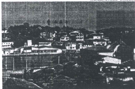
ANCHIETA, no litoral sul do Espírito Santo, tem o maior PIB per capita do Estado