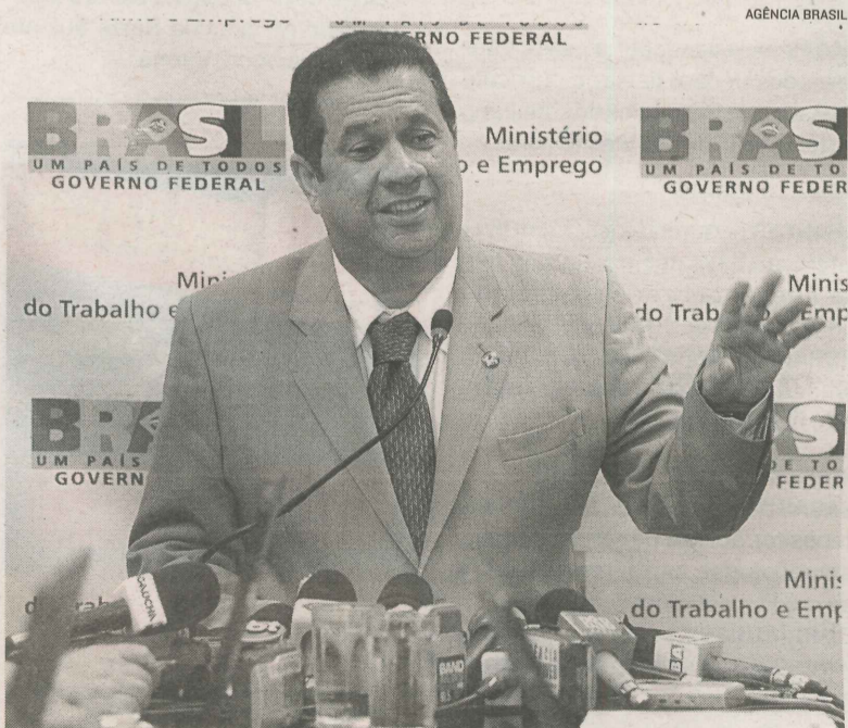
LUPI, animado com o Caged, chegou a projetar 2 milhões de vagas