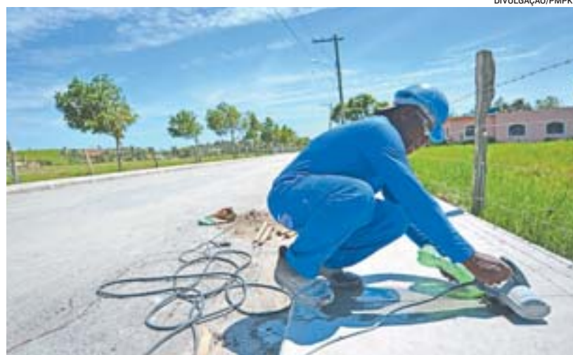
PAVIMENTAÇÃO E DRENAGEM realizada no distrito de Areinha

PRAÇA SAUDÁVEL em Marobá. Jaqueira e Santa Lúcia também ganham novas praças nos próximos meses