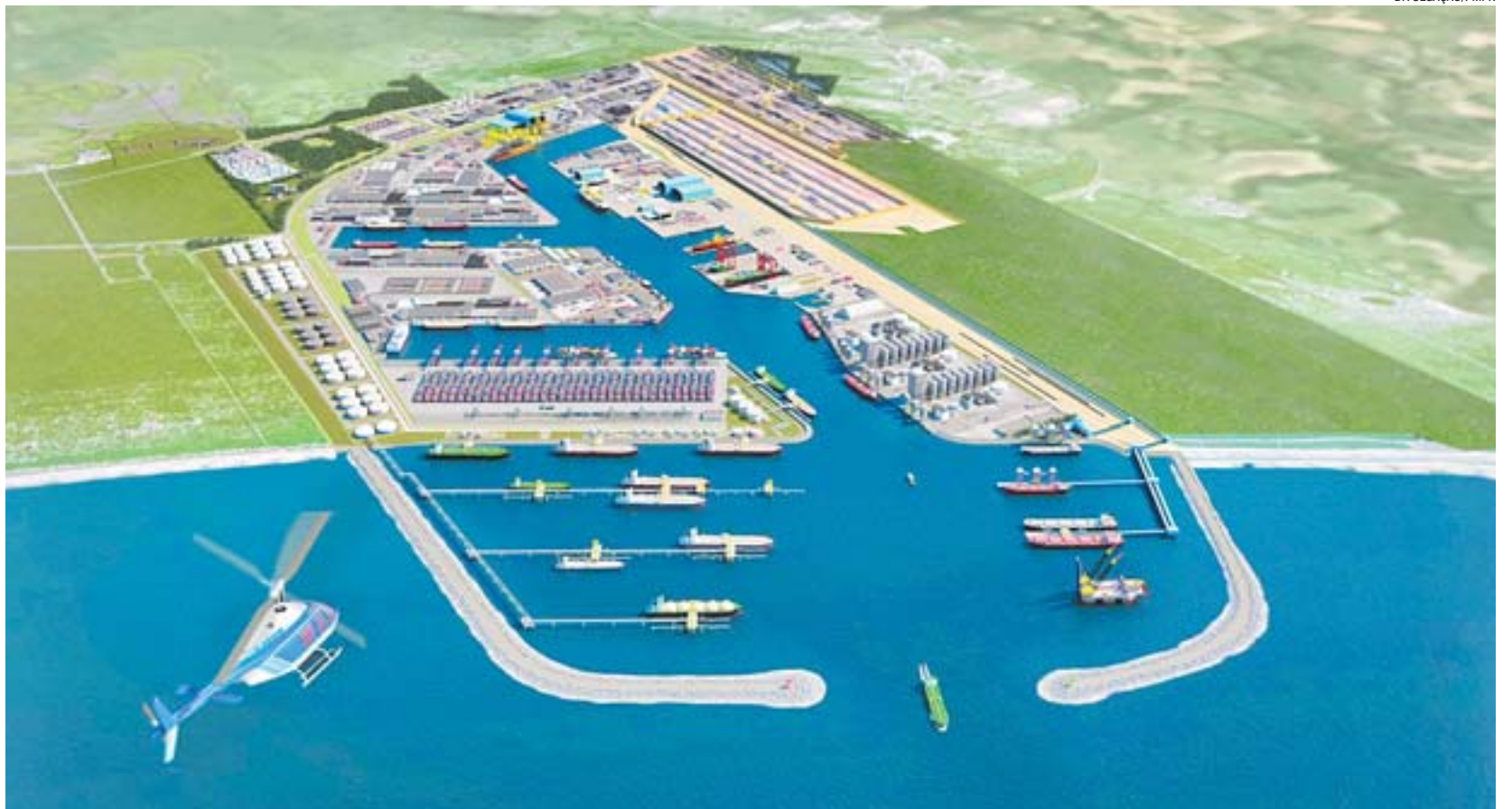
AS OBRAS DO PORTO CENTRAL devem começar em 2016 e as primeiras operações estão previstas para 2019, com investimento de até R$ 4 bilhões