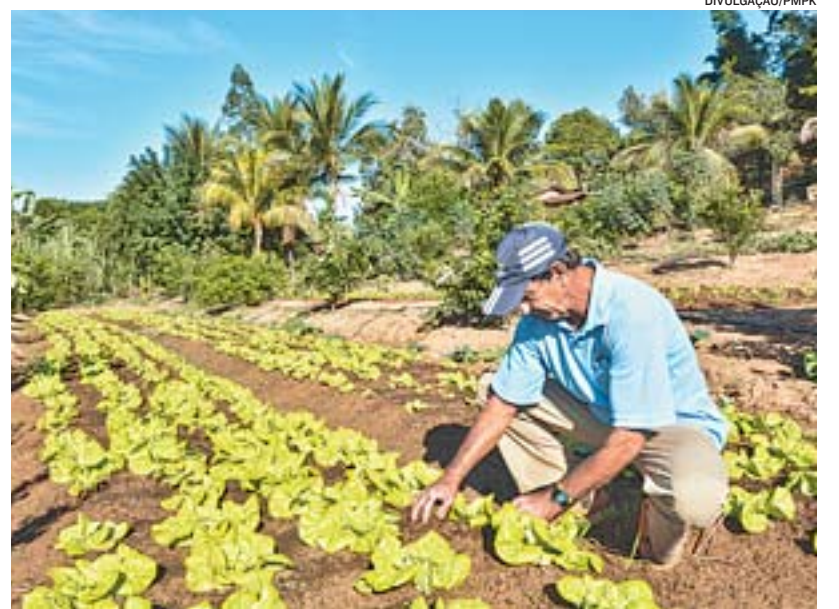
AGRICULTURA FAMILIAR: produtos da roça do agricultor direto para a feira