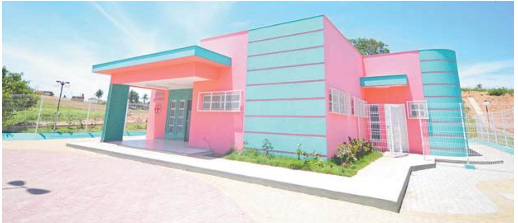
POSTO DE SAÚDE DE BOA ESPERANÇA está entre os três novos postos entregues pela administração municipal em distritos do interior do município