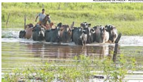
ALESSANDRO DE PAULA - 14/03/2009

A seca e a praga de lagartas que afetaram a cidade fizeram ainda com que os produtores locais vendessem cerca de 40 mil cabeças de gado, reduzindo assim o rebanho de 70 mil para 30 mil. O pro-