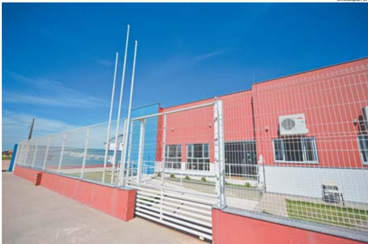
INAUGURADO RECENTEMENTE, o Centro de Educação Infantil Liane Quinta, em Marobá, ampliou oferta de vagas

Para participar do Prodes-PK é necessário ser morador de Presidente Kennedy há 5 anos, ter con-