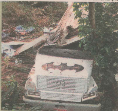
O CAMINHÃO perdeu o freio

O motorista e quatro ajudantes foram jogados para fora da cabine.