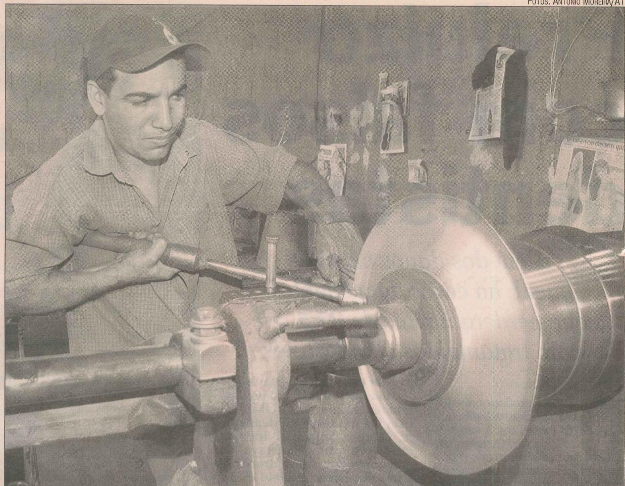
Confecção de panela em fábrica que funciona no bairro Alvorada, em Vila Velha