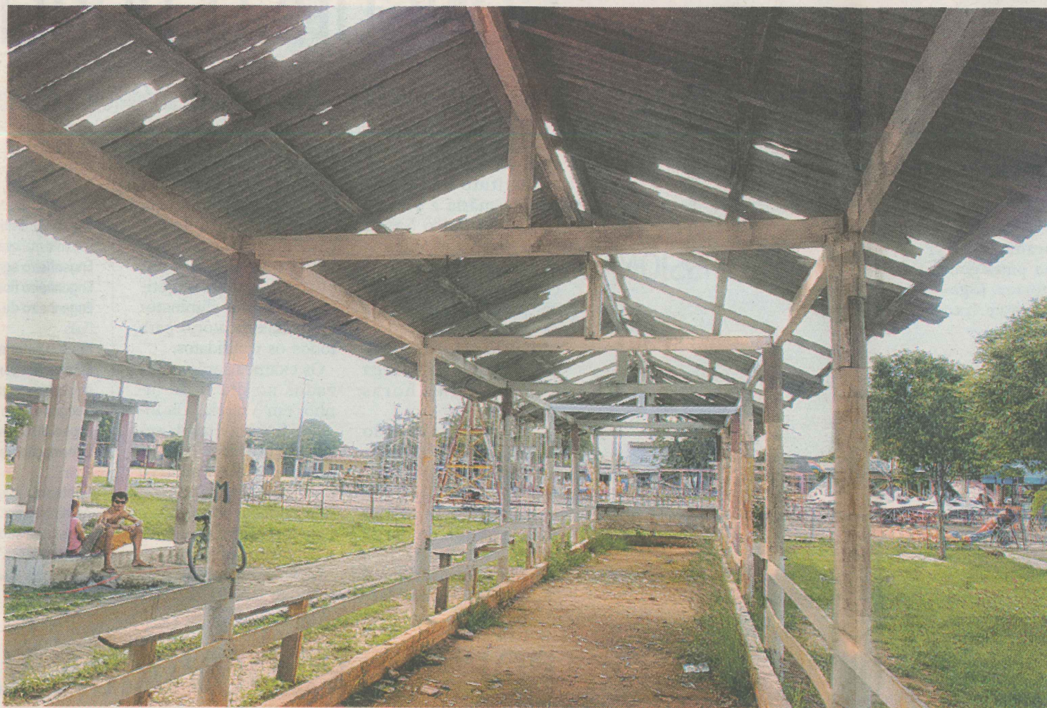
PROBLEMAS. O telhado do campo de bocha está quebrado, o campo de futebol não tem mais alambrado e a iluminação é quase inexistente.

Enquanto a reforma não acontece, a praça continua abandonada e depredada. O telhado do campo de bocha está quebrado, o campo de futebol não tem mais alambrado e a iluminação é quase inexistente, o que causa medo na população que precisa sair de casa à noite.