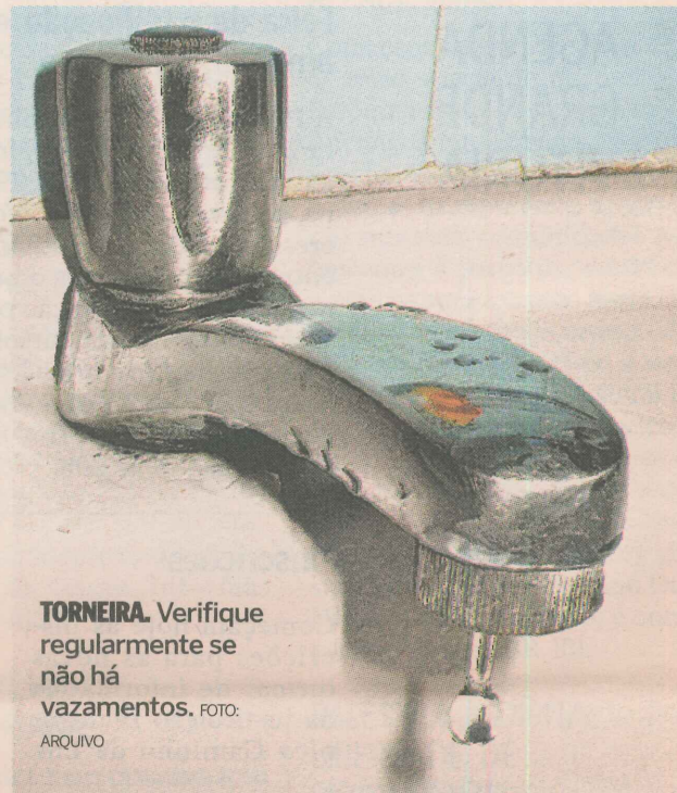
TORNEIRA. Verifique regularmente se não há vazamentos.

Para ajudar na economia, separamos uma série de dicas de como usar de forma correta os serviços de concessionárias públicas, para gastar menos.