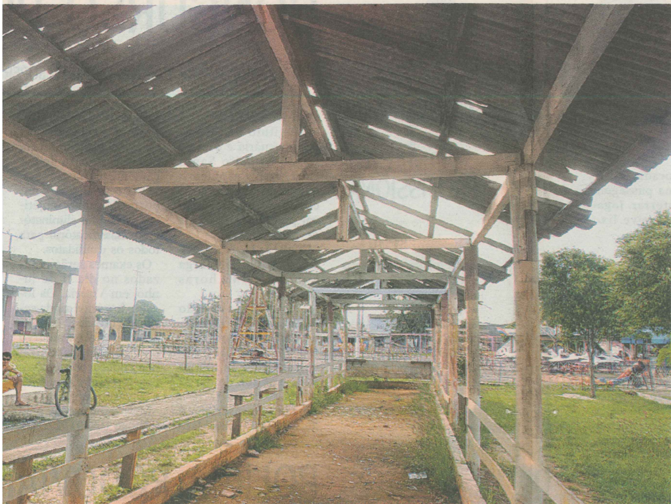
telhado do campo de bocha está quebrado, o campo de futebol não tem mais alambrado e a iluminação é quase