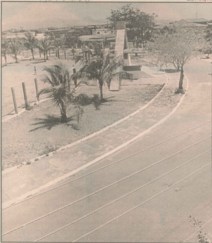
Nas praças do bairro, clima de tranquilidade