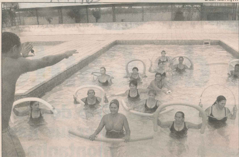
Professor de Educação Física orienta aula de hidroginástica