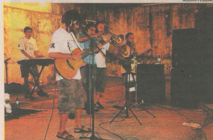
GRUPO gravou música para participar de festivais