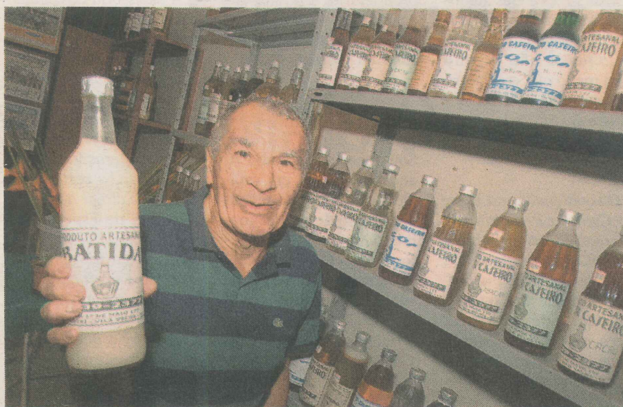
CAMPEÃS. As bebidas mais pedidas pelos consumidores são as de jenipapo, jabuticaba, contreau, menta, aracaúna, gengibre e canela.