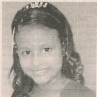
ESTHER: linha pentecostal

Paco é enfático em dizer que é apaixonado pelo bairro. "Não troco Ataíde por nenhum outro bairro. Aqui fico junto às minhas raízes", afirmou.