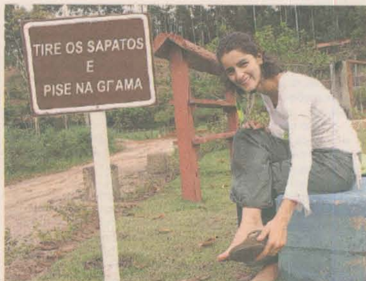
Os proprietários alertam: é permitido pisar na grama

■ A Estação Agroecológica Domaine Ile de France fica na Rodovia ES 165, km 7,5, em Pedra Azul, Domingos Martins. Para mais informações ligue para (27) 3248-3124 e (27) 3248-3128 ou acesse www.domaine.com.br .