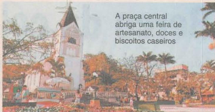
A praça central abriga uma feira de artesanato, doces e biscoitos caseiros

Lazer" os visitantes encontram mais de 20 estabelecimentos comerciais, como cervejarias, restaurantes, lojas de artesanato local e de artigos para o frio, bares, casas de chá e de chocolate quente, além das delicatessens que comercializam licores, geléias e biscoitos típicos italianos e alemães. Aconchegante e acolhedora, a rua também abriga alguns dos principais eventos da cidade