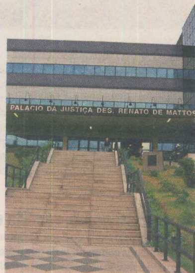
TRIBUNAL de Justiça: concurso

> HAVERÁ concurso para contratação de juiz.