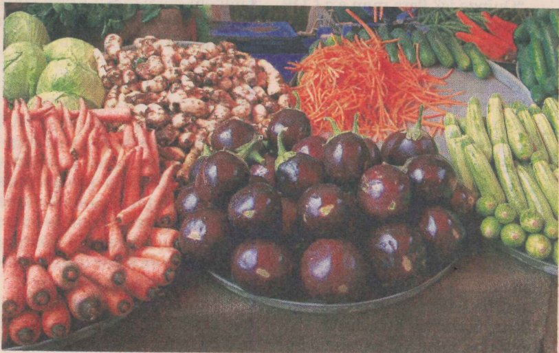
PRODUTOS EM FEIRA: benefício para servidores de Cachoeiro