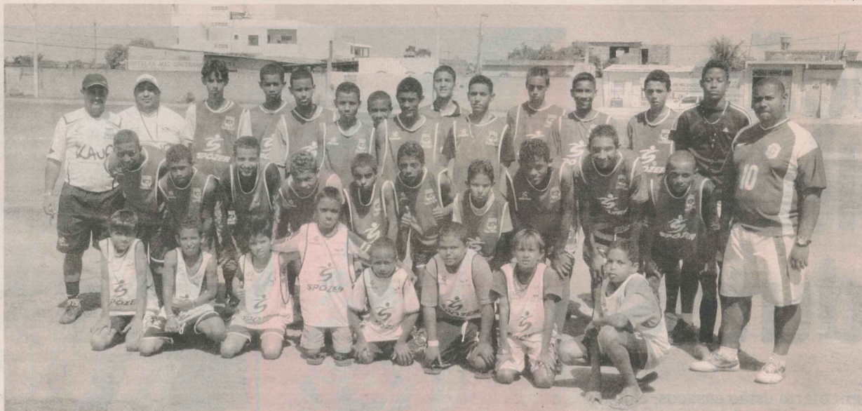
EQUIPE DO PROJETO ATLETAS DO FUTURO, que alia a prática do esporte ao bom desempenho na escola pública