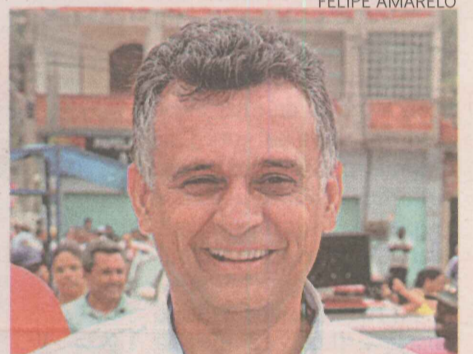
Audifax vai reestruturar a guarda