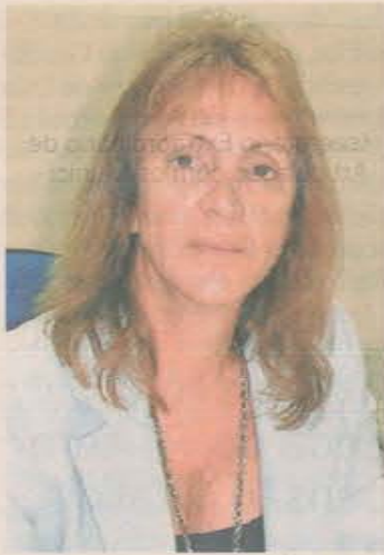
FUTURO. Moa ainda não cogita disputar a prefeitura

PROPOSTAS. Moa admite que ainda não traçou um plano de metas para os próximos dois anos. Entretanto, adianta que