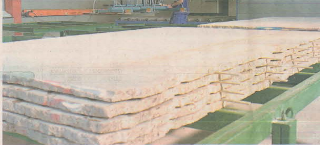
PARA CIMA. Mais de 70% da indústria, que engloba o setor de rochas ornamentais - um dos que mais crescem no Estado -, está otimista em relação ao crescimento econômico.

A pesquisa também avaliou a economia brasileira. Cerca de 80% da população da Grande Vitória aprovaram o desempenho econômico.