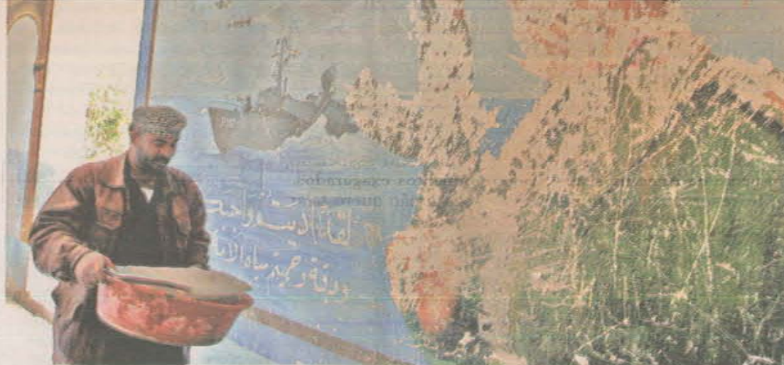
APAGADO. Iraquiano passa diante de painel com imagem raspada de Saddam Hussein na cidade de Basra; país espera apreensivo por execução do ex-ditador.

"Nós concordamos com os Estados Unidos que a entrega dele acontecerá apenas alguns minutos antes da execução", disse um oficial do governo iraquiano. O julgamento de Saddam, por assassinato e tortura, relativos ao massacre de 143 xiitas na vila de Dujail, em 1982, teve início em outubro de 2005.