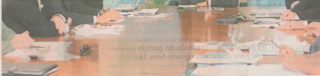
EXEMPLOS. Lula se reuniu com ministros da área social ontem, insatisfeito com a falta de centralização dos programas como microcrédito, Luz para Todos, Pro Jovem, habitação popular.

Em meio à onda de violência que atinge capitais como Rio de Janeiro e São Paulo, Lula cobrou dos ministros ações que possam criar alternativas para os jovens. A falta de integração dos programas sociais é um dos principais problemas apontados no diagnóstico feito pelo Ministério do Desenvolvimento Social (MDS), responsável pelo Bolsa Família. Apesar de