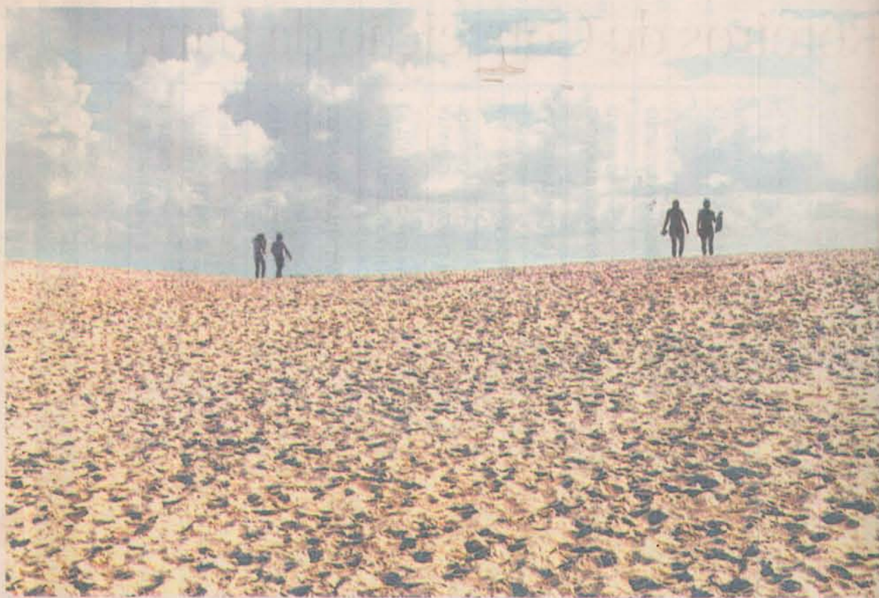
DESERTO TROPICAL. Em Itaúnas, para chegar à praia é preciso vencer as dunas, que chegam a 30 metros de altura. De seu cume é possível apreciar um belo pôr-do-sol, tendo como cenário o mar e o Rio Itaúnas.