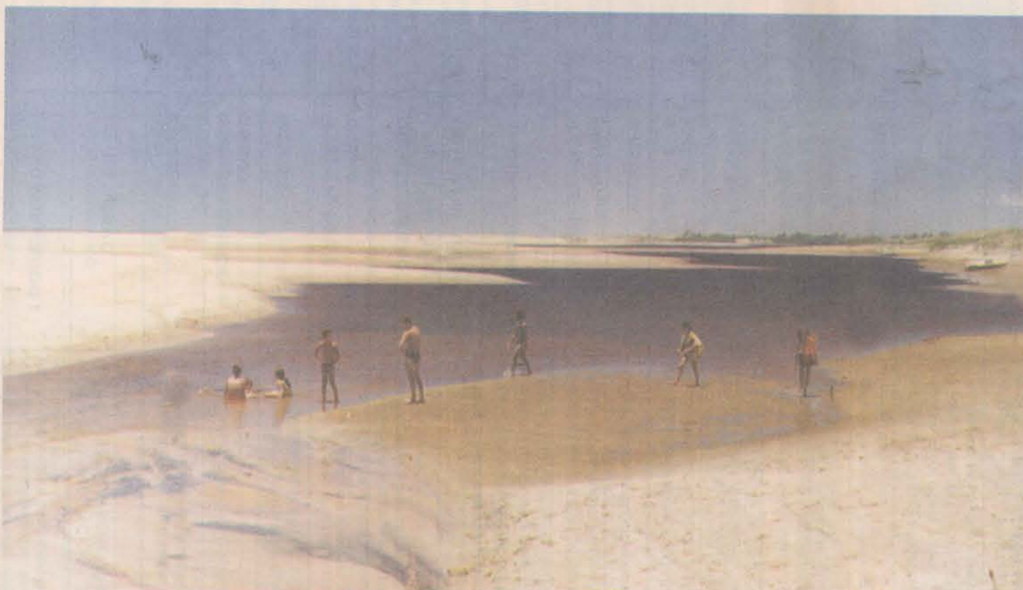
RELAX. A Praia de Urussuquara, entre Linhares e São Mateus, além de surfistas e bodyboarders, abriga uma comunidade de pescadores. É grande a variedade de peixes na região. O pacato vilarejo é próprio para quem quer descansar do agito da cidade.