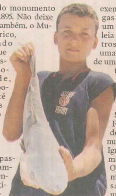
TROFÉU. Em Urussuquara é comum ver até crianças pescando.

Dê uma passadinha, também, no Centro Ecológico, inaugurado em 1987, com sala de exposição,