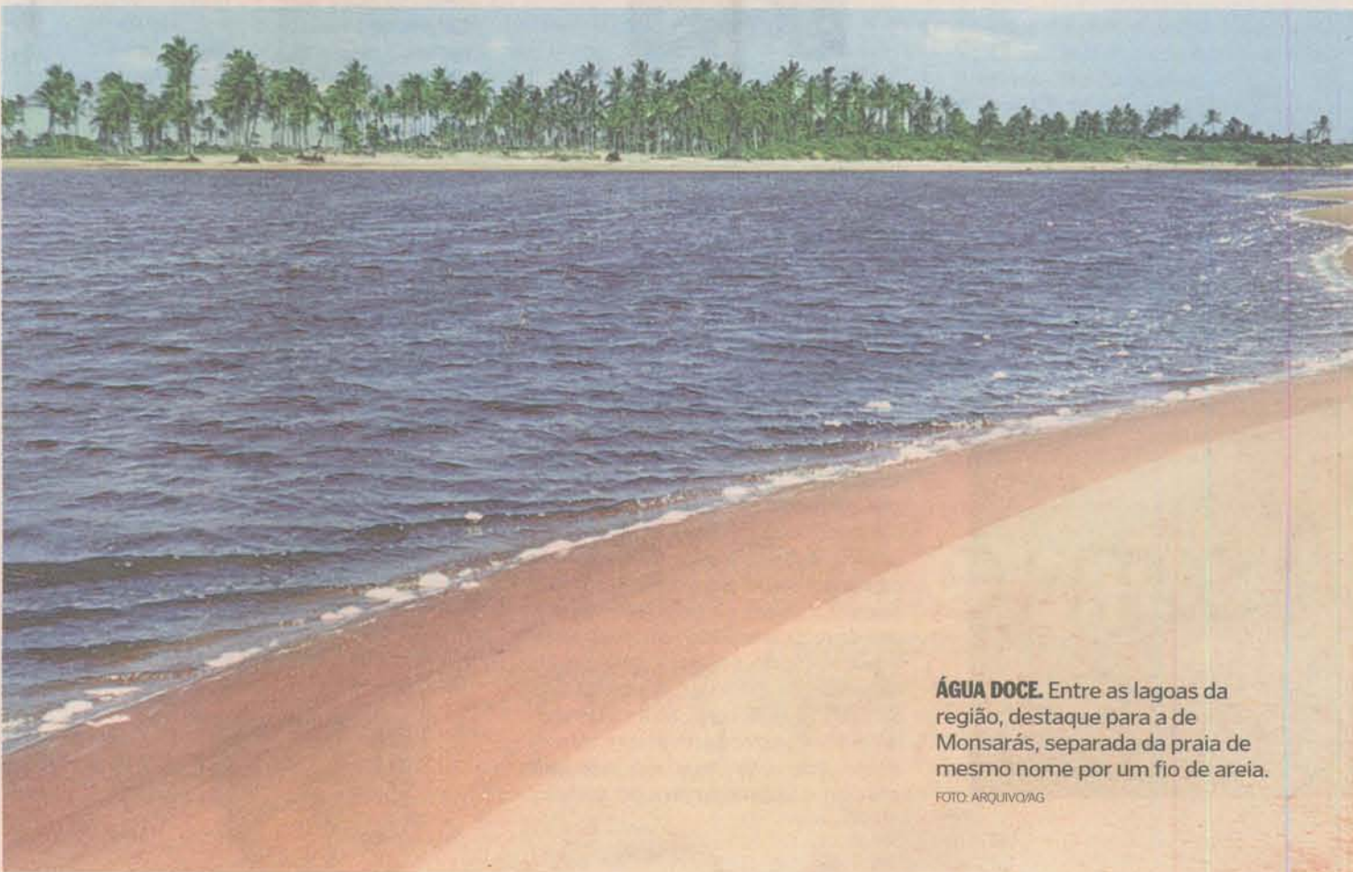
ÁGUA DOCE. Entre as lagoas da região, destaque para a de Monsarás, separada da praia de mesmo nome por um fio de areia.

Origem. O Rio Doce entra no Espírito Santo através de