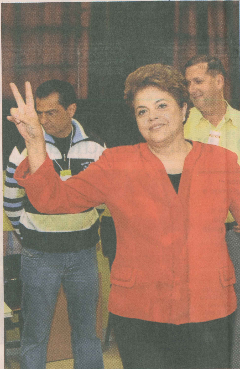
NOVA BATALHA. Dilma teve cerca de 45 milhões de votos (46%), enquanto José Serra recebeu apoio de 32 milhões de eleitores, o que representou 32% da votação

Serra teve mais votos nos Estados de São Paulo, Paraná, Santa Catarina, Mato Grosso, Mato Grosso do Sul, Rondônia, Acre e Roraima. Marina venceu no Distrito Federal. Dilma ganhou nos demais Estados.