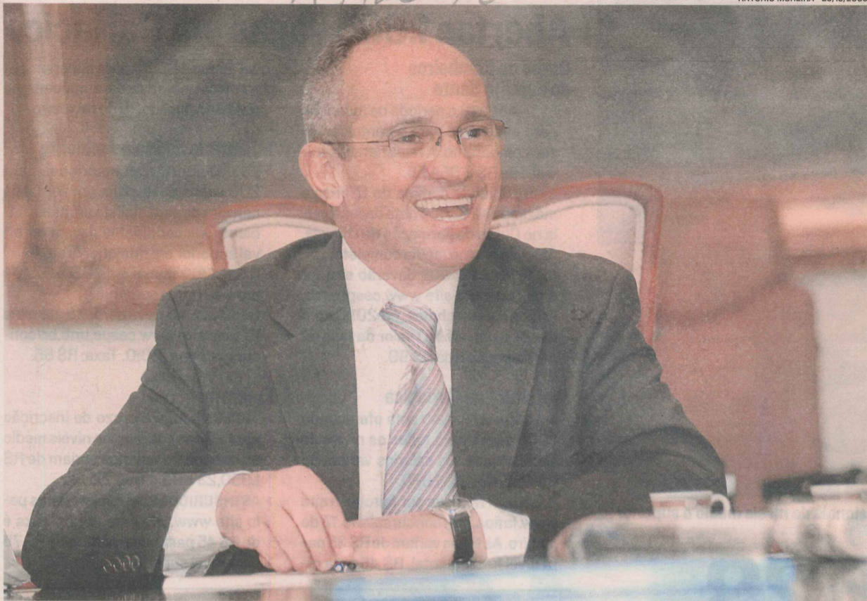
PAULO HARTUNG destacou que o sucesso da gestão é resultado do trabalho realizado pela equipe de governo