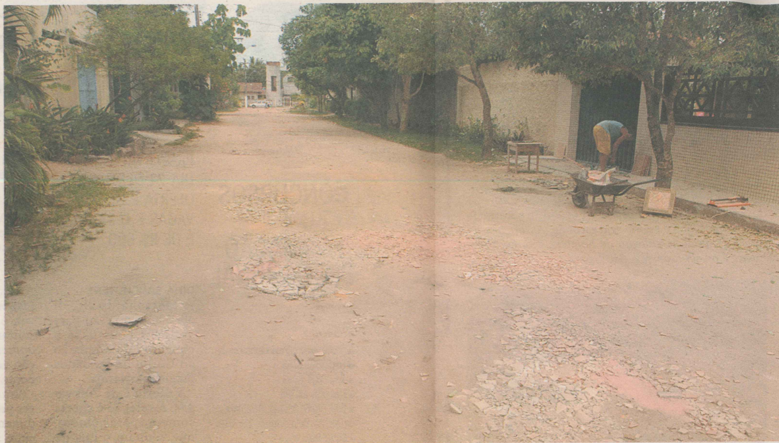
CALÇAMENTO. Quando chove, circular pelas ruas principais da Barra do Jucu é difícil por causa das poças de lama. No tempo seco, sobra poeira. FOTO:

TOME NOTA: Amanhã, confira quais são os orgulhos da Barra do Jucu. E no sábado, o mapa do bairro.