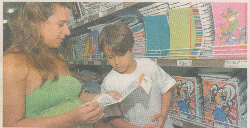
QUESITOS. Pais devem ver qualidade, segurança, preço e formas de pagamento.

Além disso, a escola deve informar qual o modelo de uniforme utilizado, assim como os locais onde pode ser adquirido. O fornecimento exclusivamente pela escola é considerado venda casada, o que é proibido por lei.