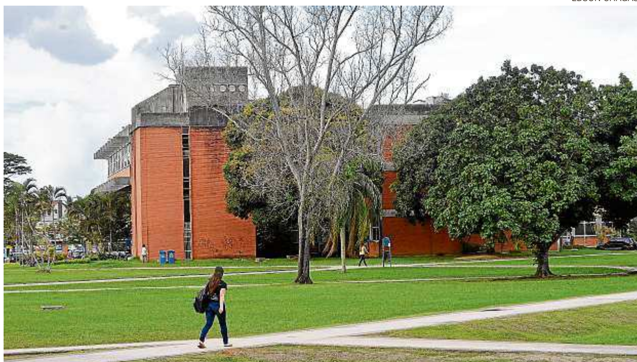
A Ufes vem recebendo um valor baseado no orçamento de 2014, de R$ 740 milhões, mas com 33% de redução

▄ A Universidade Federal do Espírito Santo (Ufes) tem um orçamento para 2015 maior do que Cariacica. Enquanto está previsto um repasse de R$ 780 milhões para a instituição, a cidade prevê recursos em torno de R$ 741 milhões. Porém, a universidade aguarda o decreto presidencial de contingenciamento para saber quanto receberá de fato e passa por dificuldades financeiras.