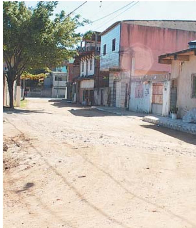
RUA VITÓRIA RÉGIA , em Zumbi dos Palmares, onde não há calçamento