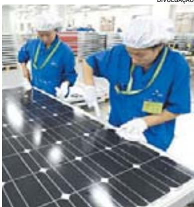
TECHNO-CELLS: 300 vagas