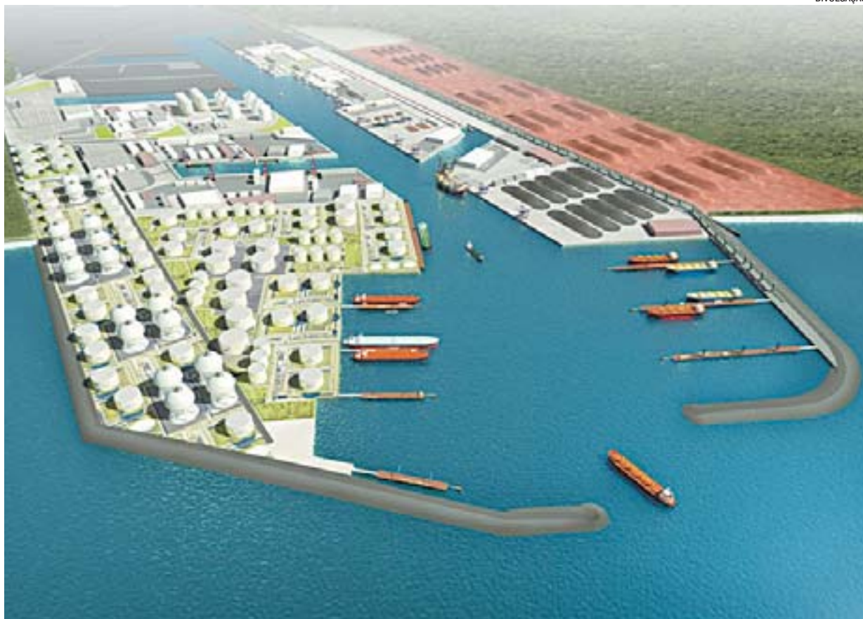
PERSPECTIVA DO PORTO CENTRAL, em Presidente Kennedy: investimento de R$ 4,5 bilhões e 4.500 empregos