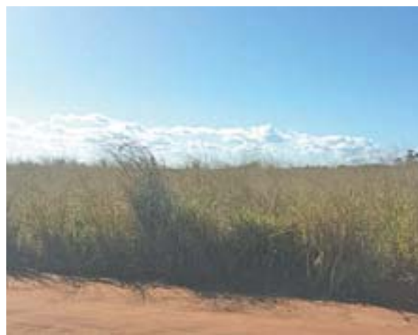
OXFORD, fábrica de porcelanas de mesa que está sendo construída em São Mateus, microrregião Nordeste do Estado. No detalhe, área antes no início das obras

Outro empreendimento importante que está em construção é a fábrica de porcelanas para mesa Oxford. “Estamos tornando o município mais competitivo”, finalizou.