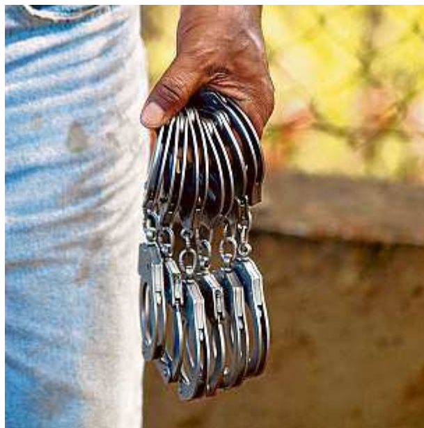
Para prender todos, seriam necessárias mais 36 cadeias

Ricas adiantou que o sistema prisional capixaba está em ampliação.