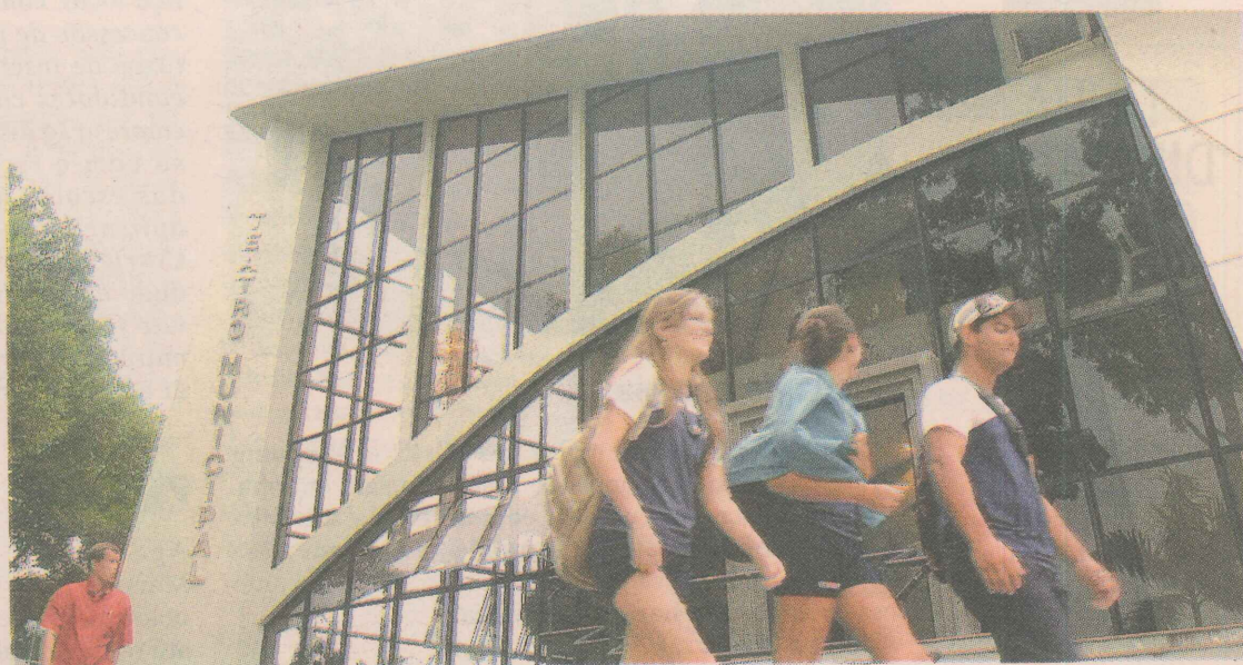
TETO. A cobertura do teatro mostra uma arquitetura ousada para a década de 1960, quando o prédio foi construído.

TEATRO MUNICIPAL HÉLIO VIANA DEIXOU DE SER O PRÉDIO DA ADMINISTRAÇÃO MUNICIPAL, EM 1992, PARA VIRAR TEATRO COM CAPACIDADE PARA 322 PESSOAS E ABRIGAR A GALERIA DE ARTES EUGÊNIO PACHECO DE QUEIROZ