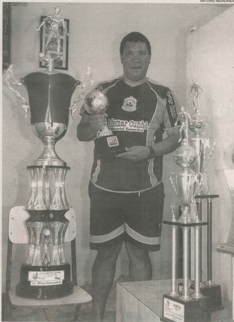
WANDESLON exhibe os troféus conquistados pela escolinha de futebol

Para participar da escolinha, basta fazer a inscrição, às terças e quintas, das 8 às 10 horas e das 14h30 às 17h30, no Tartarugão.