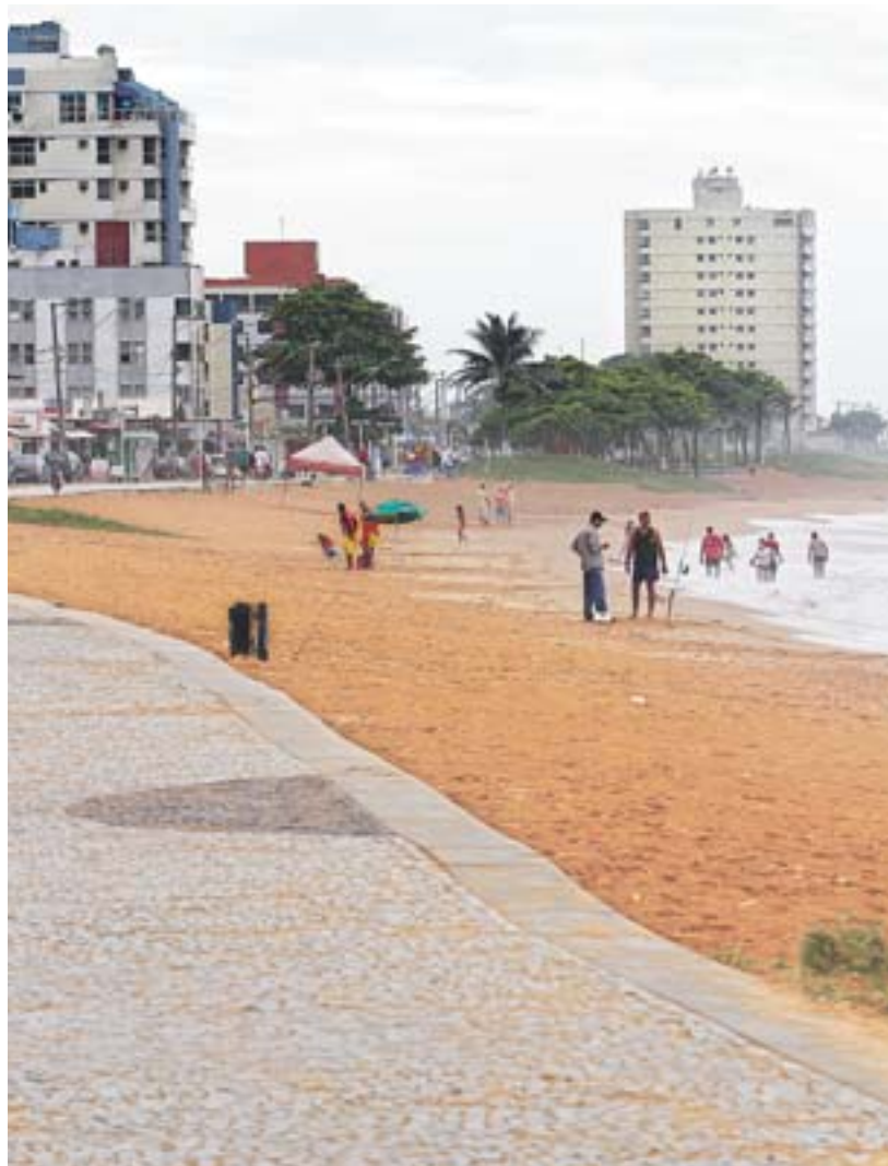
PRAIA de Jacaraípe, na Serra, onde faltam sanitários para os banhistas

Manuel disse que a coleta foi regularizada, mas a falta dos sanitários continua sendo um problema para os visitantes