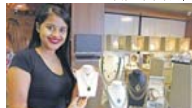
BRUNA: colar com pedra é tendência