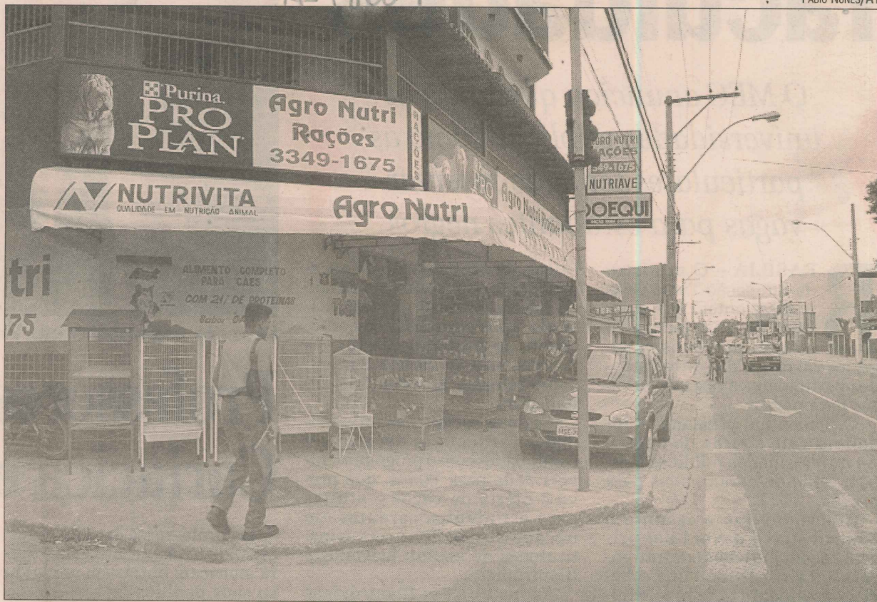
A avenida Allan Kardec concentra variedade de estabelecimentos comerciais