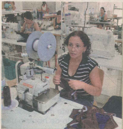
DINEUSA: sungas são o foco