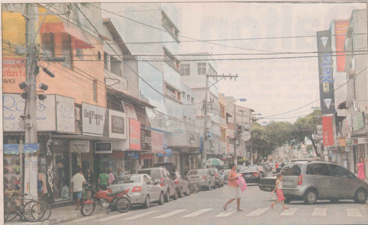
O Pólo de Confeccões da Glória possui cerca de 350 lojas e representa 12% do ICMS do município

Os moradores da Glória, que formam o quarto maior reduto eleitoral canela-verde, receberam