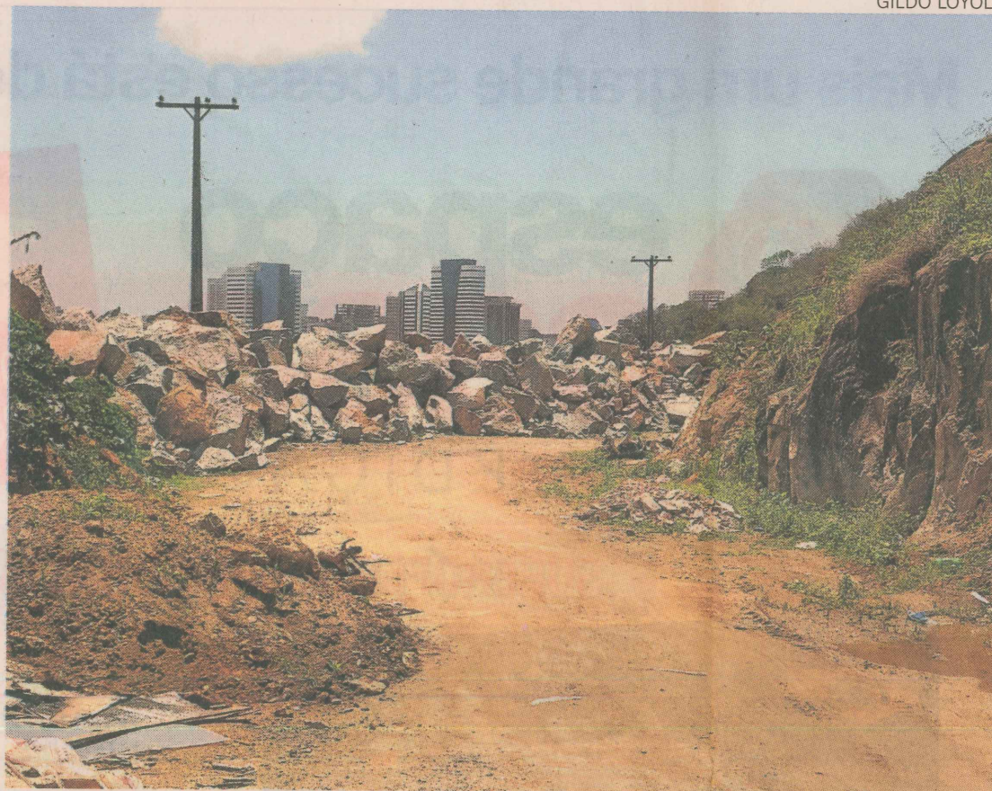
PEDRAS NO CAMINHO. Moradores da Glória querem saber de onde saíram e para que servem as pedras que foram parar na Prainha da Glória. O local está feio e bastante sujo