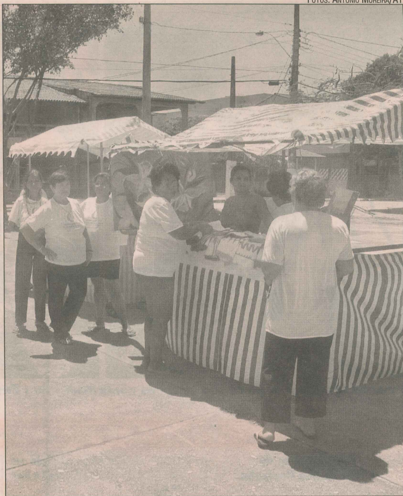
Movimento na praça de Guaranhuns: feira a partir do mês que vem

cos e mesas. Além disso, vamos fazer uma revisão na iluminação e colocar alambrado no entorno do local”, ressaltou.