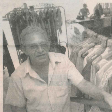
VICENTE oferece descontos

Em breve ele irá oferecer calçados e aumentar a linha de acessórios.