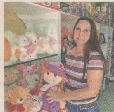
FERNANDA: de brinquedo a roupas

O que não é difícil no local é, entre pelúcias, brinquedos, acessórios e roupas, o cliente comprar um presente e acabar levando algo mais.