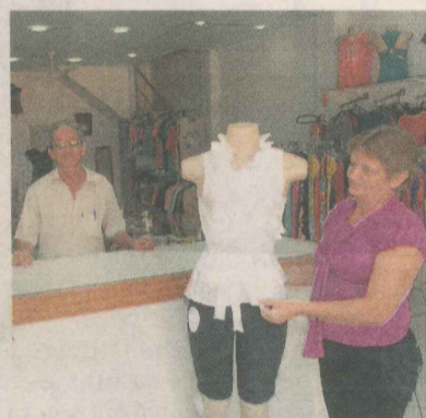
DIVINO E ADELAIRE: roupa feminina

Hoje, a experiência é vista na qualidade das peças, vendidas, também, para sacoleiras e lojistas.