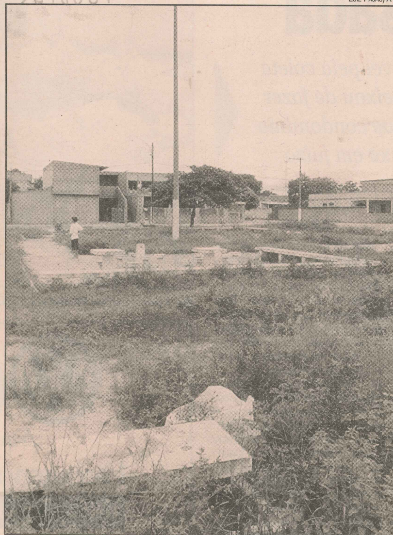
Moradores da Ilha dos Bentos reclamam da falta de lazer

A dificuldade de acesso ao bairro é outra queixa da população. O único ônibus que passa pelo local, além de não percorrer as ruas internas, vive lotado, pois atende também às comunidades