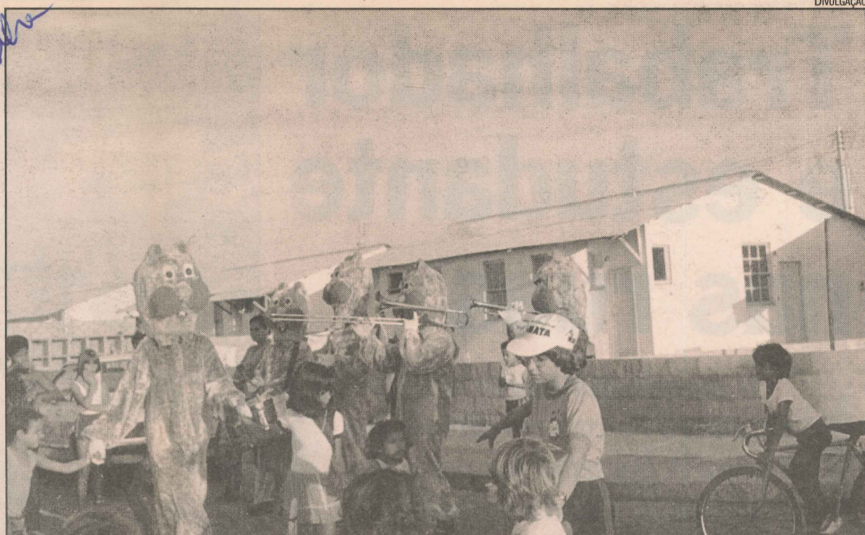
Na inauguração do conjunto habitacional em 1982, banda dos esquinhos da empresa BMG

O bairro, que começou como conjunto habitacional, possui ruas com nomes de frutas, como Pinhas, Uvas e Pêssegos