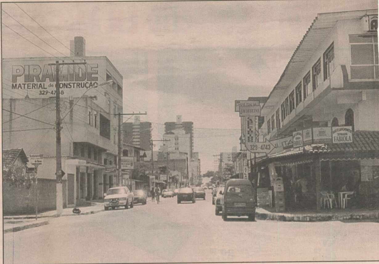
A avenida Resplendor é uma das vias de acesso aos dois quilômetros de praia em Itapoã