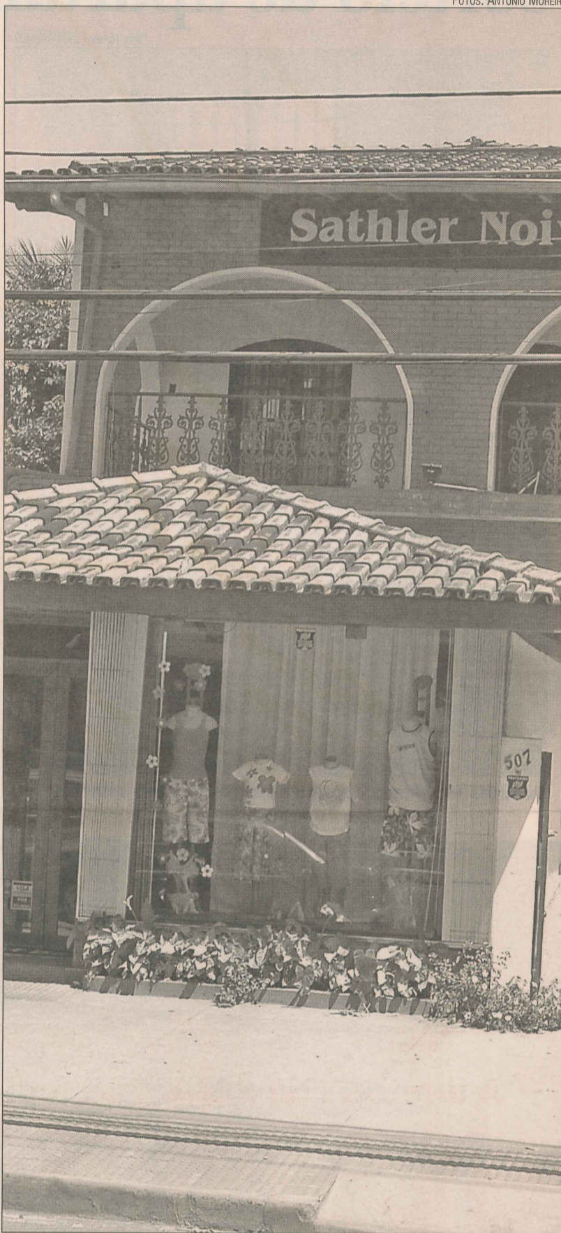
Loja de artigos de noivas que está funcionando em casa antiga