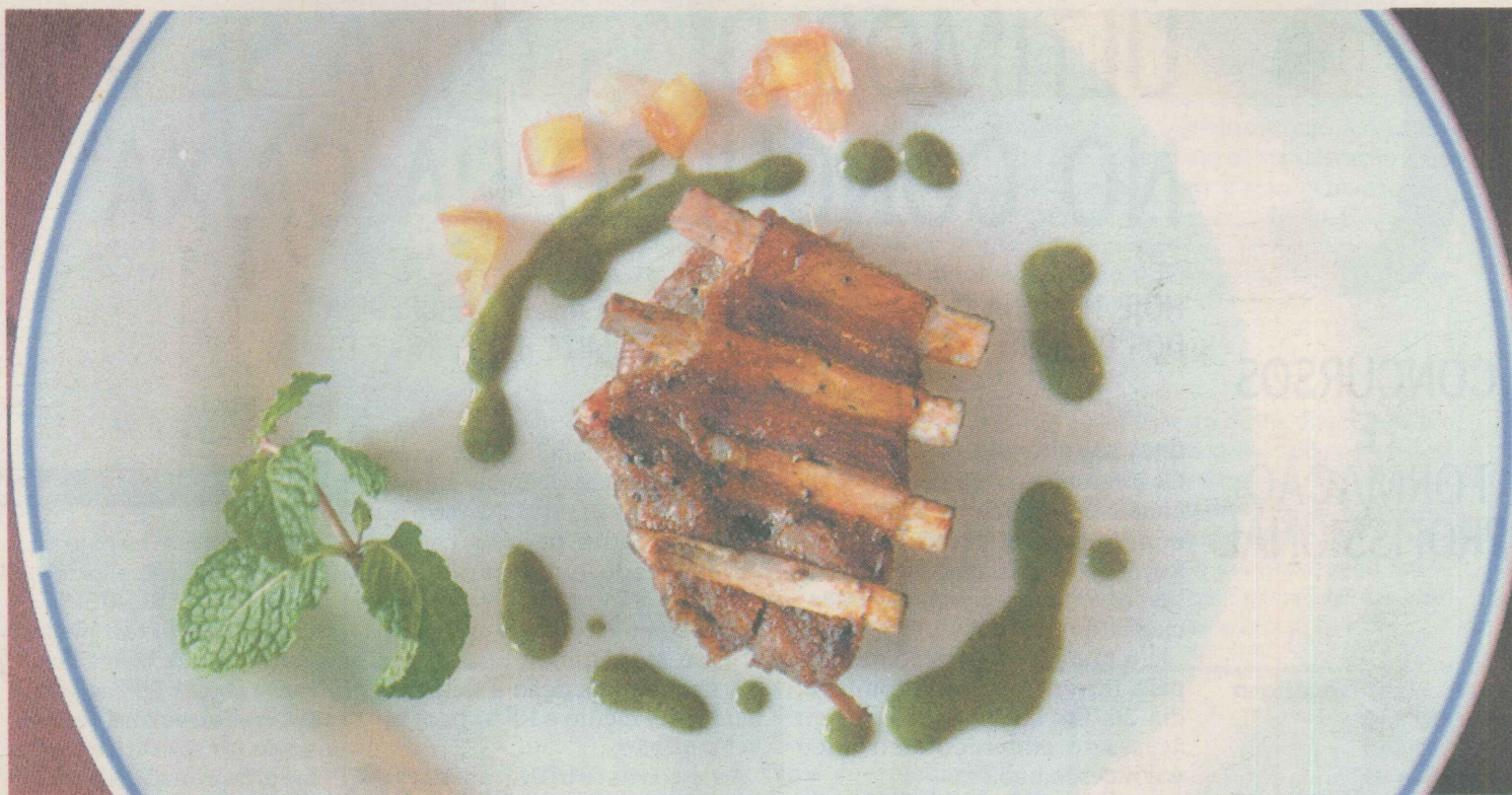
PRATO PRINCIPAL. No Arroba, muitos aproveitam o final de tarde para tomar uma cervejinha bem gelada e saborear a famosa costela de cordeiro ao molho de hortelã.