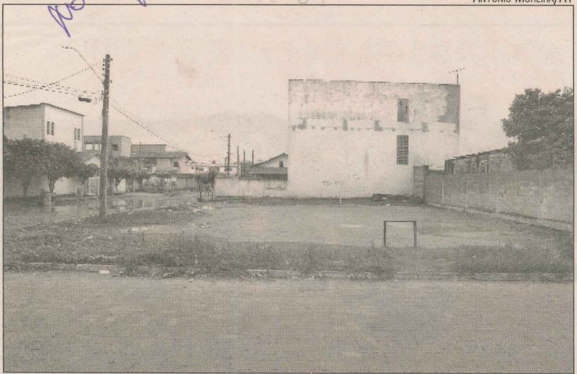
Terreno onde as crianças improvisam campo de futebol