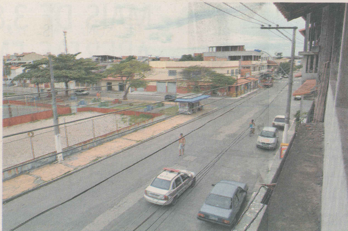
EVOLUÇÃO. Quando foi fundado, bairro não tinha energia elétrica. Hoje, infra-estrutura é boa.

Atualmente, o bairro cresceu muito, assim como a economia no local. Hoje, são mais de 5,1 mil habitantes.