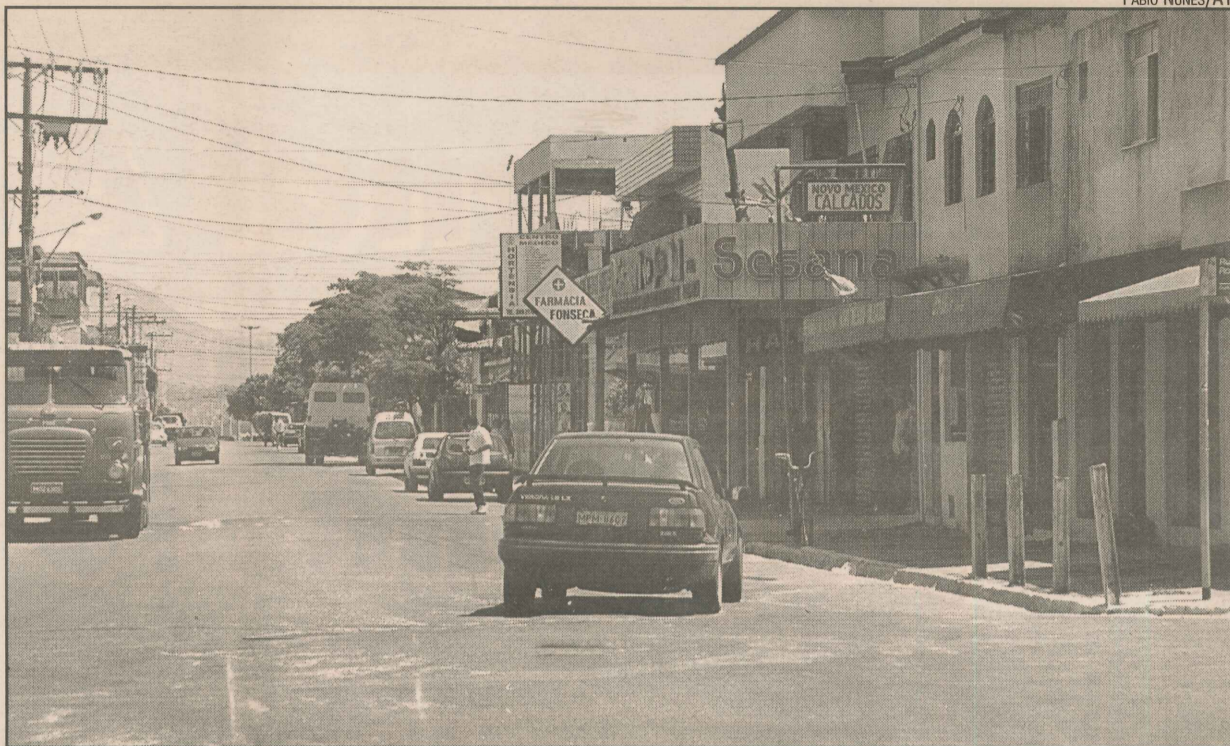
Na avenida Leila Diniz, podem ser encontradas mercearias, farmácias e lanchonetes