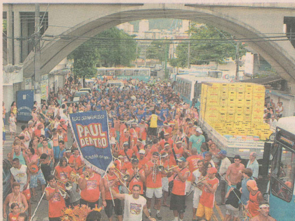
PREMIAÇÃO. Este ano, bloco ficou em segundo lugar em concurso promovido em Vila Velha.