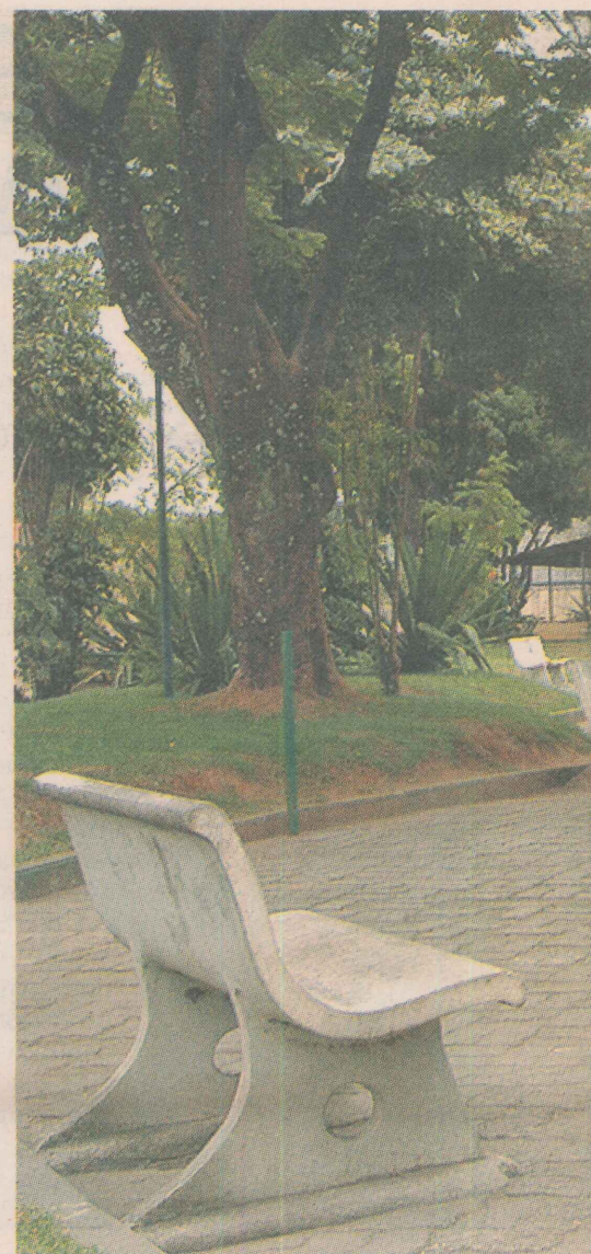
POUCA OPÇÃO. Praça é um dos poucos espaços de

TOME NOTA: Amanhã, leia as entrevistas com dois comerciantes de Paul: os fundadores das Lojas Si-polatti e da Rede Constrular. E no sábado, não perca o mapa ilustrado.