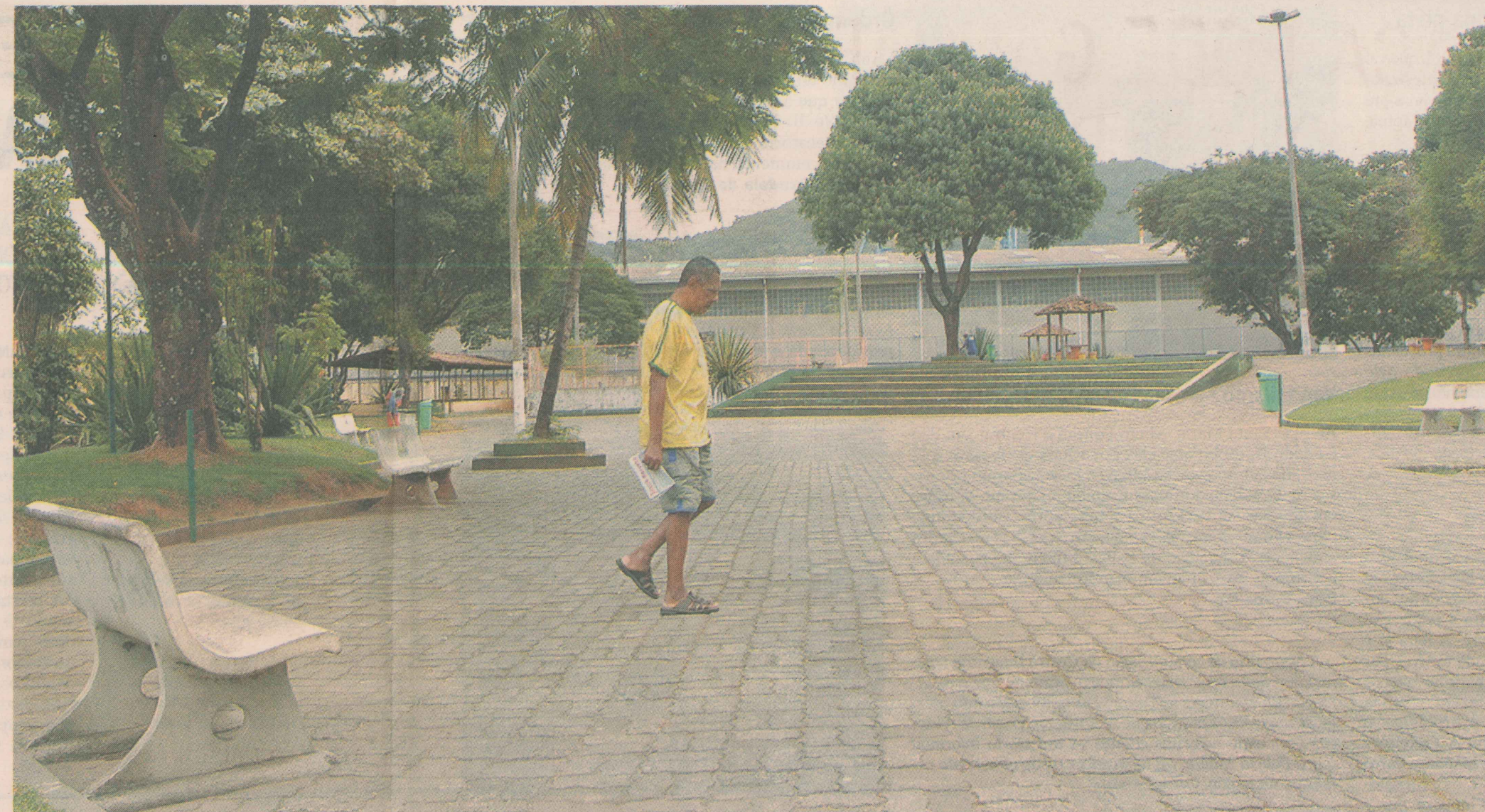
POUCA OPÇÃO. Praça é um dos poucos espaços de lazer e diversão que estão disponíveis em Paul, para realização de eventos.

Fonte: Única Imóveis. Avenida Hugo Musso, 1476, Praia da Costa. Telefone: 3041-0000.