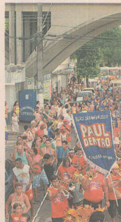
PREMIAÇÃO. Este ano, bloco ficou er Velha.