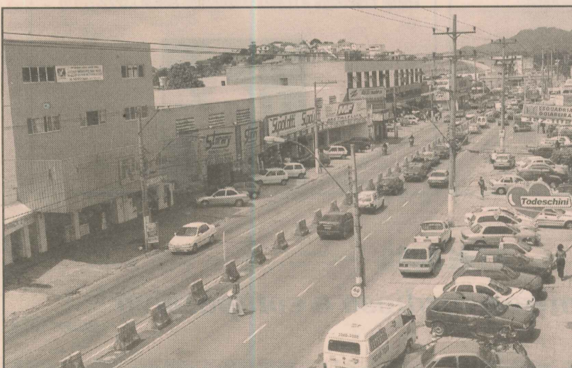
A avenida Fernando Ferrari concentra o comércio

A Univix começou a funcionar em 1999, em Jardim da Penha, com quatro cursos: Administração, Contabilidade, Engenharia de Produção Civil e Farmácia. Hoje, são nove: além dos quatro primeiros, a faculdade conta com os cursos de Arquitetura, Direito, Engenharia Elétrica e Psicologia.