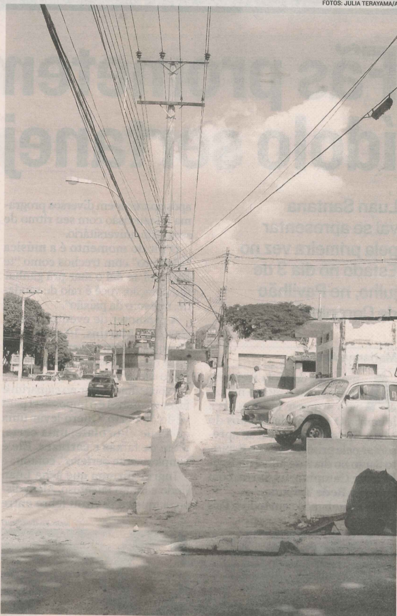
UM DOS TERRENOS desapropriados na avenida Fernando Ferrari