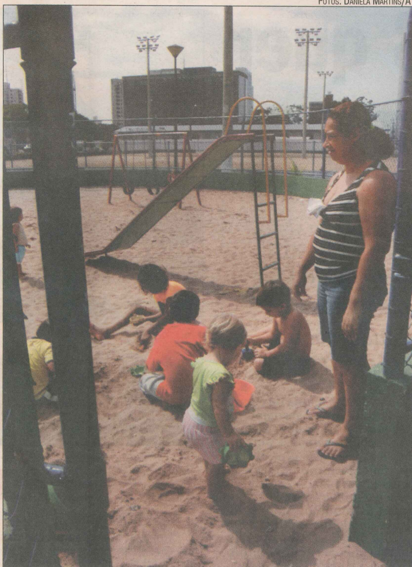
Crianças brincam no playground de praça na Praia do Suá